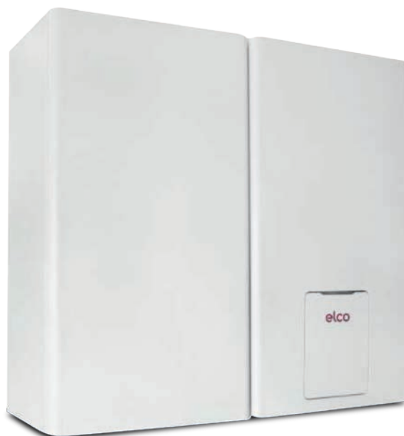
Elco Vistron W50 H og Elco Thision Mini