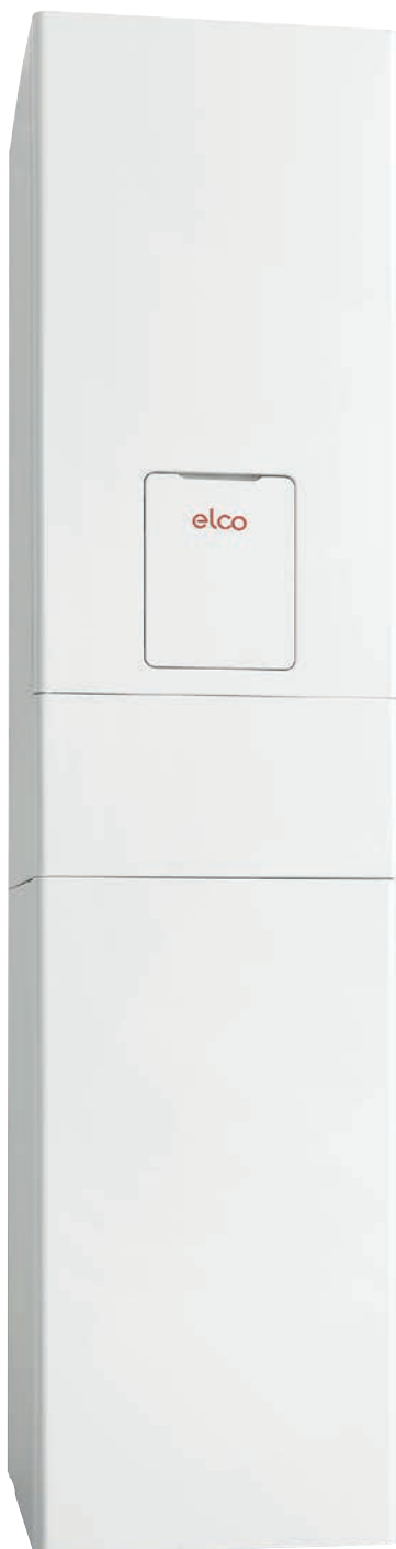
Elco Vistron W50 V og Elco Thision Mini