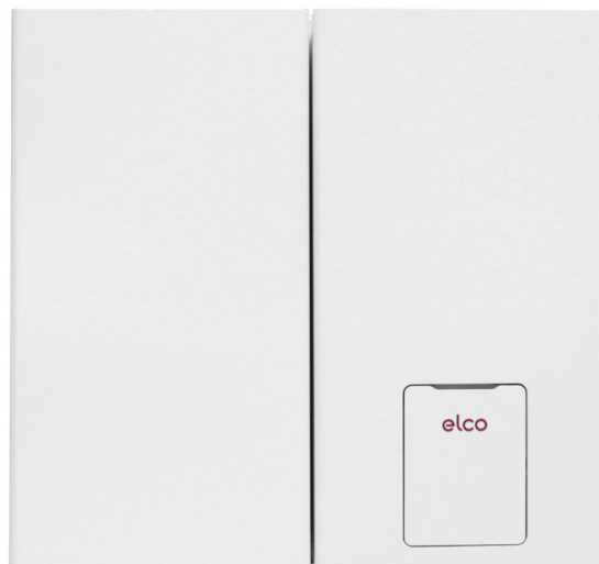
Elco Vistron W50 H og Elco Thision Mini